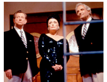
1997 CROISIÈRE AVENTUREUSE (Out to Sea) de Martha Coolidge avec Elaine Strich, Alan Alda