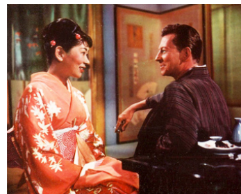
1960 OPÉRATIONS GEISHAS (Cry for happy) de George Marshall avec Miyoshi Umeki