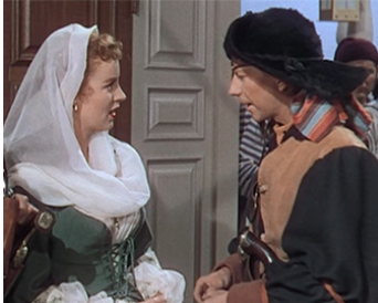
1951 LE JOYEUX CORSAIRE (Double Crossbones) de Charles Barton avec Helena Carter