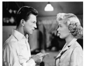
1949 NOUS LES HOMMES (Yes sir that's my Baby) de George Sherman avec Gloria DeHaven