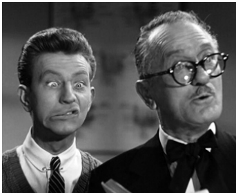
1952 FRANCIS CHEZ LES CADETS (Francis goes to West Point) d'A. Lubin avec W. Reynolds