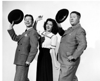
1944 THE MERRY MONAHANS de Charles Lamont avec Peggy Ryan, Jack Oakie