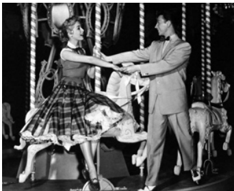
1953 LES YEUX DE MA MIE (Walking my baby back home) de Lloyd Bacon avec Janet Leigh