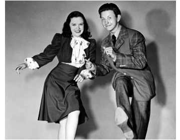
1942 ESCAPADE EN MUSIQUE (Get hep to love) de Charles Lamont avec Gloria Jean