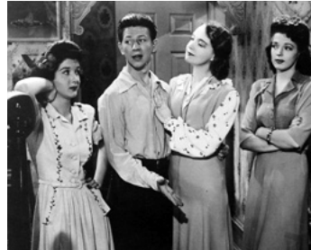
1943 PLACE AUX JEUNES (Top Man) de Ch. Lamont avec Peggy Ryan, Anne Gwynne, Susanne Foster