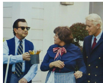
1982 PANDEMONIUM (Pandemonium) d'Alfred Sole avec Kaye Ballard, Judge Reinhold