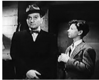
1939 DEATH OF A CHAMPION de Rohert Florey avec Harry Davenport