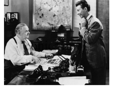
1953 FRANCIS JOURNALISTE (Francis covers the Big Town) d'A. Lubin avec Gene Lockhart