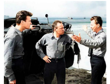
1955 FRANCIS DANS LA MARINE (Francis in the Navy) d'A. Lubin avec C. Eastwood, R. Erdman