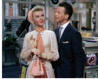
1952 SON EXCELLENCE L'AMBASSADRICE (Call me madam) de W. Lang avec Vera-Ellen