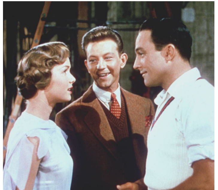
1952 CHANTONS SOUS LA PLUIE (Singin' in the Rain) de Gene Kelly et Stanley Donen avec Debbie Reynolds, Gene Kelly