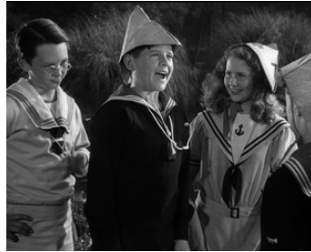
1939 BEAU GESTE (Beau Geste) de William Wellman avec Billy Cook, Ann Gillis