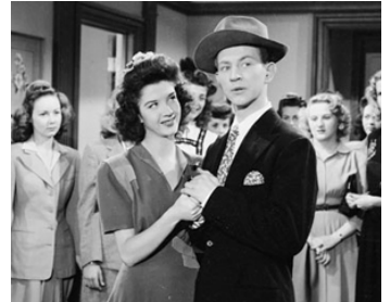
1943 LE FLIRT DES CORRIGAN (Chip off the old block) de Charles Lamont avec Ann Blyth