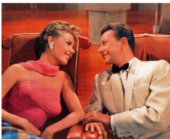
1956 QUADRILLE D'AMOUR (Anything goes) de Robert Lewis avec Mitzi Gaynor