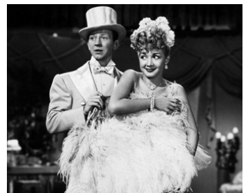
1948 FAISONS LES FOUS ((Are you with it ?) de Jack Hively avec Olga San Juan