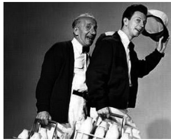
1950 LE LAITIER SONNE UNE FOIS (The Milkman) de Charles Barton avec Jimmy Durante