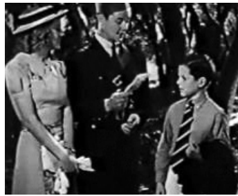
1938 LES FILS DE LA LÉGION (Sons of Legion) de James P. Hogan avec E. Keyes, Lynne Overman