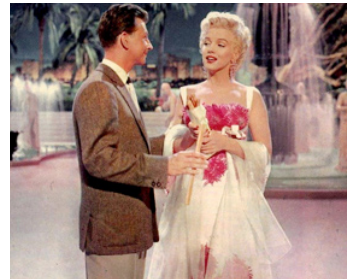
1954 LA JOYEUSE PARADE (There's no business like show business) de W. Lang avec M. Monroe