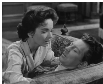
1957 L'HOMME QUI N'A JAMAIS RI (The Buster Keaton story) de S. Sheldon avec Rhonda Fleming