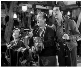
1938 BÉBÉS TURBULENTS (Sing your sinners) de W. Ruggles avec Bing Crosby, F. MacMurray