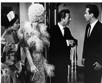
1964 CHAMBRE À PART (That funny feeling) de Richard Thorpe avec Sandra Dee, Bobby Darin