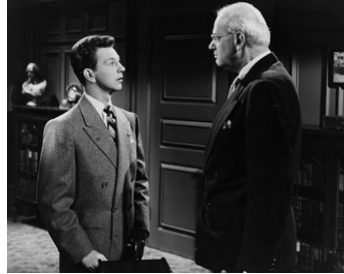
1951 FRANCIS AUX COURSES (Francis goes to the Races) d'A. Lubin avec Cecil Kellaway