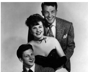
1947 CHANSON DANS LE VENT (Something in the Wind) d'I. Pichel avec D. Durbin, John Dall