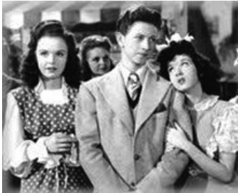
1942 WHEN JOHNNY COME MARCHING HOME de Ch. Lamont avec Gloria Jean, Peggy Ryan