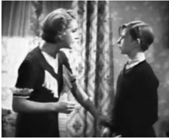
1938 LE RETOUR DU GANGSTER (Unmarried) de Kurt Neumann avec Helen Twelvetrees