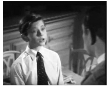
1938 BOY TROUBLE de George Archainbaud avec John Artley