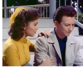
1953 CUPIDON PHOTOGRAPHE (I love Melvin) de Don Weis avec Debbie Reynolds