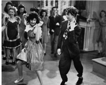
1943 MISTER SWING (Mister Big) de Charles Lamont avec Peggy Ryan