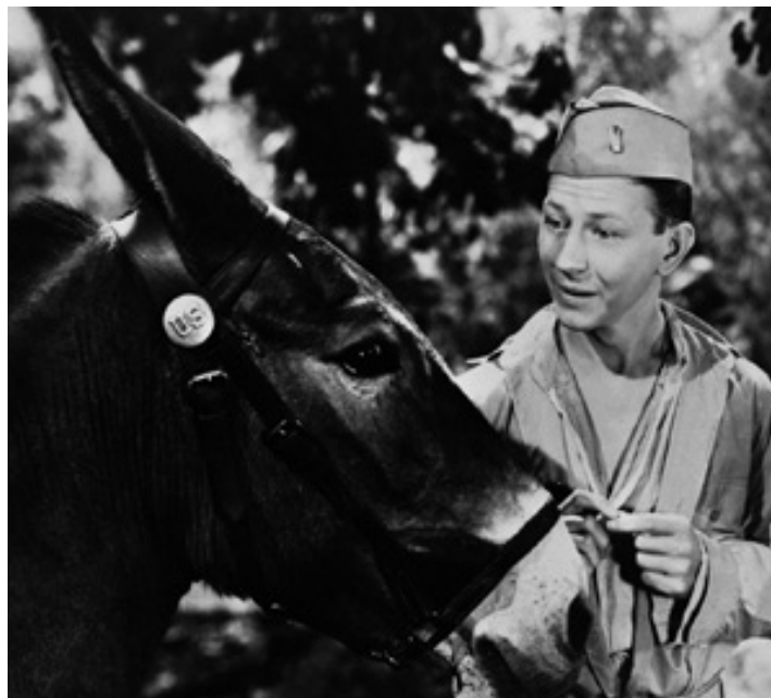
1949 FRANCIS (Francis the talking mule) d'Arthur Lubin